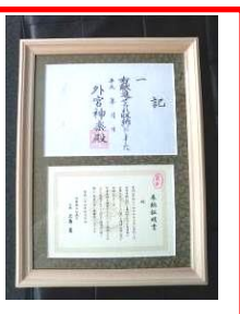
▲収納証・奉納証明書用の 桧額 (オプション)