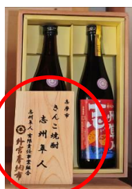
▲献備台木札 (手数料に含む)