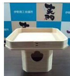
▲三方 (8 寸 24cm×24 cm) (手数料に含む)