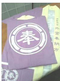
▲代表者用法被 (手数料に含む)