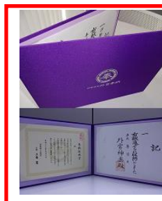
▲収納証・奉納証明書用の 布製ホルダー