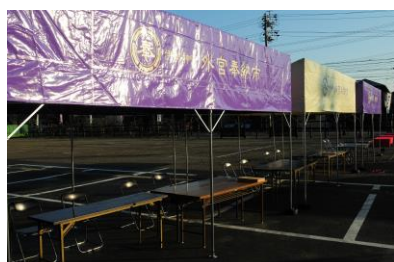
▲外宮奉納市オリジナルテント